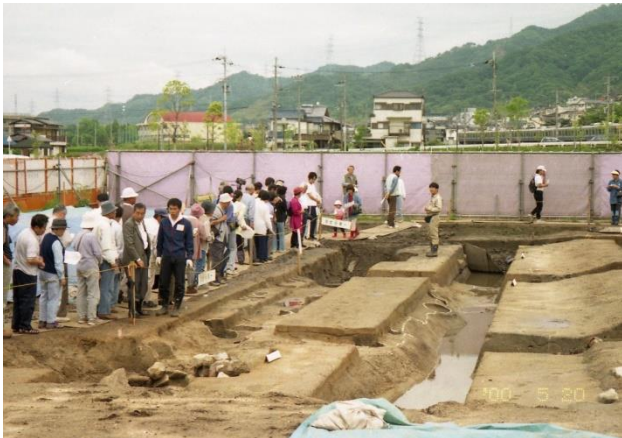
三宅山荘園遺構?発掘調査現地説明会

考古学の基本的は人間が残した遺跡、遺物であるから、それらを得るため、発掘調査が研究の中心となる。