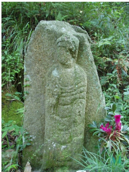
左側のお顔が痛々しい