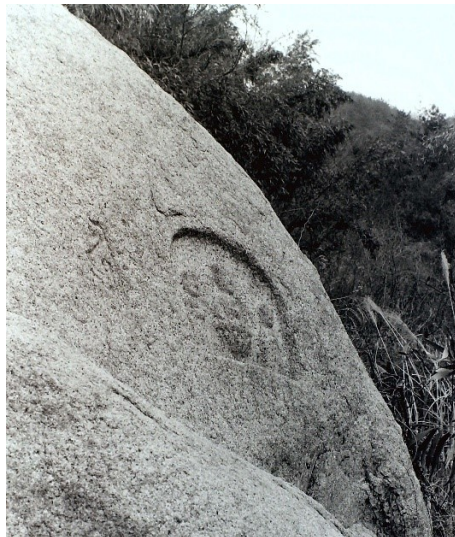
文明十一年（1479）の刻銘(室町中期)