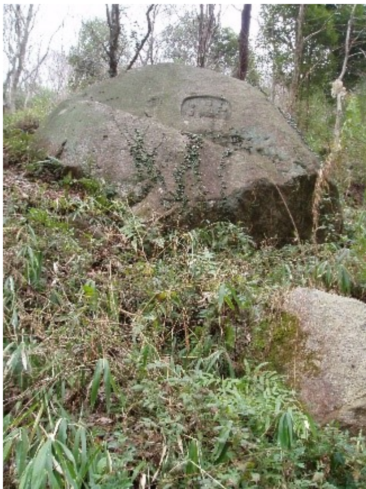
阿弥陀三尊磨崖（右・観音菩薩 左・勢至菩薩）

どんなに極悪非道の人間でも阿弥陀如来の名をとらえ、拜めばかならず極楽往生が遂げられといわれています。