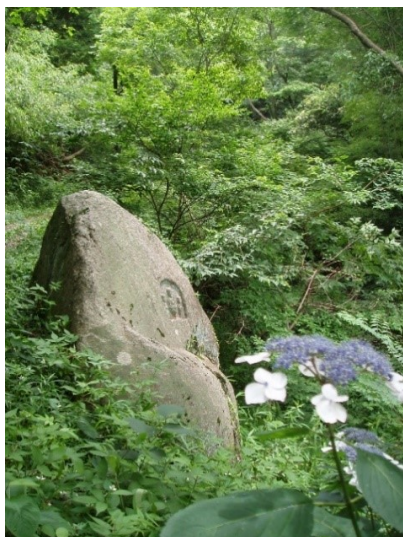
見過ごす人が多い