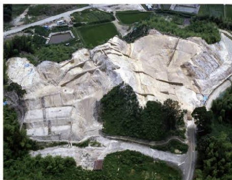
津田城遺跡本丸山北東地区発掘調査遠景

お願い 市民講座のご参加においては、新型コロナウイルス感染拡大防止対策にご協力ください。マスクの着用など、飛沫防止を遵守してください/咳や発熱、その他体調不良を感じる場合は、展示鑑賞や講座のご参加をご遠慮ください/「大阪コロナ追跡システム」の登録にご協力ください。新型コロナウイルス感染状況によっては、展示会や講座の内容の変更や、中止の可能性もありますので、ご了承ください(その際は公式サイトにて発表いたします)。