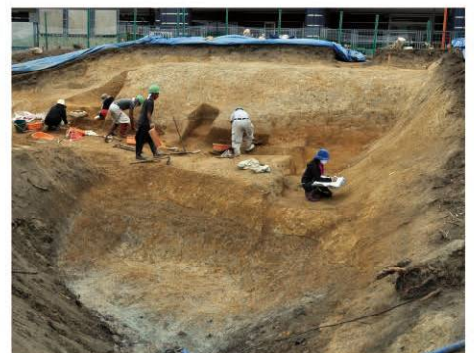
私部城跡発掘調査で検出した堀・郭・土塁(2020年9月撮影)