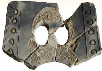
津田城遺跡本丸山北東地区出土瓦

『交野町史』刊行から約半世紀が経ち、交野出身の考古学者・画家の片山長三氏がかつて描いた北河内の歴史像は、その後の研究や調査によって大きく発展しました。今回の展示と講座では、片山氏の研究成果と私部城跡をはじめとする多くの遺跡の近年の調査成果を中心に、交野～枚方の戦国時代を紹介します。