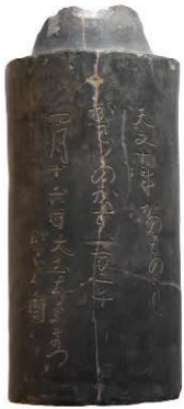
茨木市梅林寺所蔵刻銘丸瓦(枚方町の工人作)