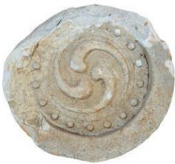
津田城遺跡本丸山北東地区出土軒丸瓦