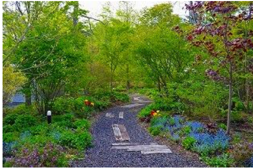
南ヶ丘のメイン通路の庭

15年間利用していた軽井沢町太郎山山荘から現軽井沢町南ヶ丘に移って3年目を迎えましたが、4月中旬〜GWに続き今回も珍しい宿根草と高山植物(山野草含む)を注文したり、そのデザインをしながら、新しく入荷する宿根草と高山植物の場所作りです。