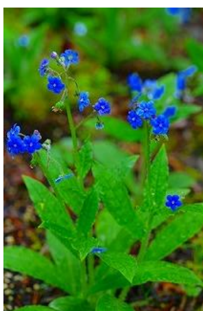
絶滅寸前の瑠璃草ト城

珍種と言えば、軽井沢では見たことの無いイエローバードが咲き出しました。同木は、ヨーロッパが原産で、背丈が10m程です。1か月程咲いています。上品な花です。ただ、軽井沢に多いコブシが害を及ぼし育て方が難しいので、夏場に業者の手で根気良く3、4回消毒を依頼しています。