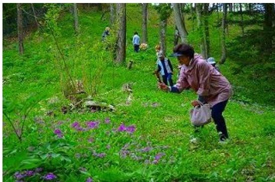
サクラソウと瑠璃草の生存地

サクラソウの生存地は、北面と西面で、朝こぼれ陽が入り、PMは大木の影で乾燥から守られています。普通、花の雌蕊は雄蕊よりも長い(長花柱花と言う)のですが、サクラソウは殆ど短花柱花でした。そして、サクラソウと瑠璃草が共存していました。