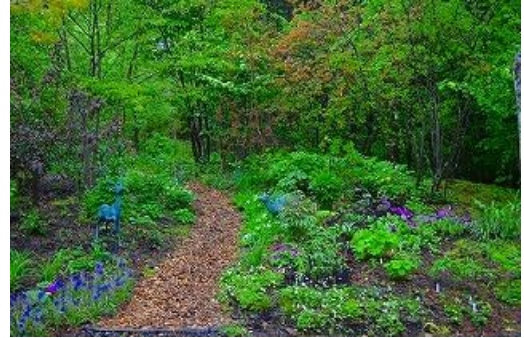
南ヶ丘の高山植物ゾーンの庭

宿根草は、約400種ありますが1/3に当たる約145種を5/28に入荷し旧新の入れ替えを行います。