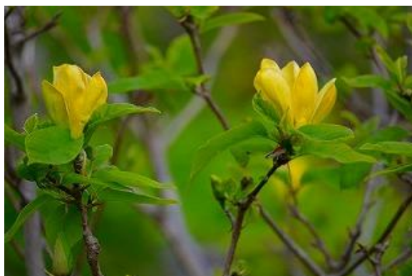
珍種イエローバード/木蓮の一種

PS : 今日、「軽井沢サクラソウ会議」のメンバーにロシア人の女性が参加していました。昨年クロアチアのプリトヴィツェ湖国立公園内で黄花アザミを見つけ、ありとあらゆる手を施していますが、国交が開けていないことから、入手のメドが立っていません。彼女によると、ロシアにも黄花アザミが生存しているようで、種子を取り寄せられないかと依頼しました。この様に、珍種は八方手を尽して取り寄せています。