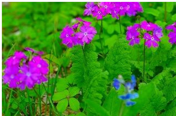
サクラソウ/手前右は瑠璃草